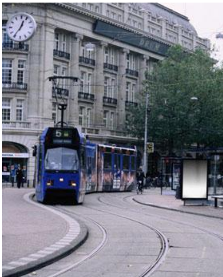
O tranvía é unha opción pouco contaminante

B. Entre cidades: o transporte público non remata na cidade, posto que gran parte da conxestión e contaminación procede de vehículos que veñen de fóra. Por iso é tan importante dotar de transporte público tanto ás grandes cidades como as zonas interurbanas. É moi importante crear un servizo integrado de ferrocarrís e autocares coordinados en horario que cubran a totalidade do territorio en función da demanda.