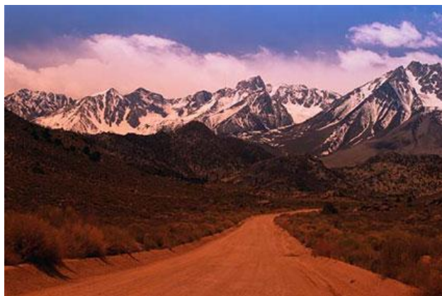
As estradas adoitan cortar zonas naturais, fragmentando os hábitats

Como aspecto positivo, os progresos tecnolóxicos están a permitir reducir os niveis de contaminación atmosférica xerados polo transporte. Non obstante, necesítanse máis iniciativas? para resolver o problema da contaminación atmosférica nas urbes.