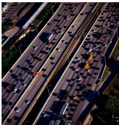
Cada vez hai un parque de vehículos máis numeroso